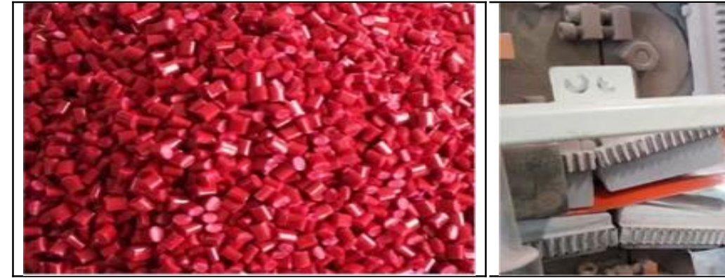
1. Çeşitli hammaddeler belirli bir yüzde karıştırma, hazneye