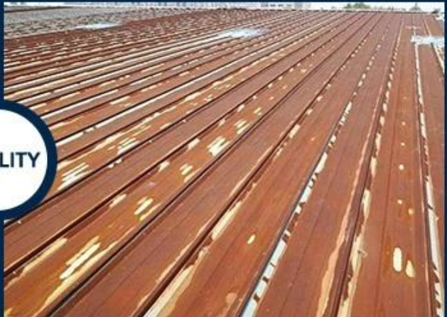
Rusty and perishable