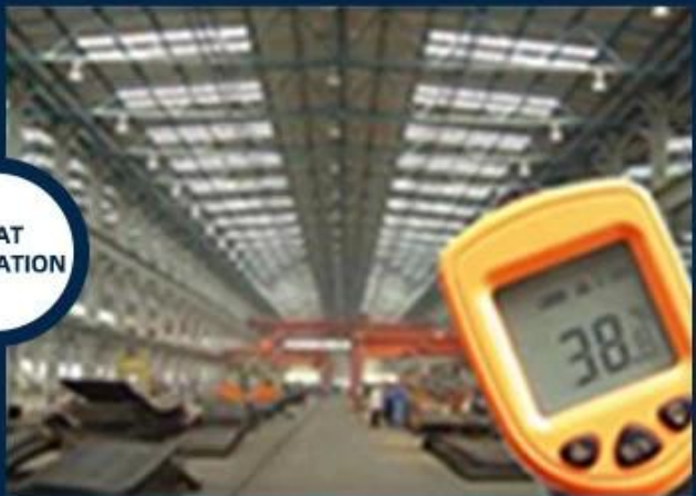
Direct sunlight iron tile Temperature too high