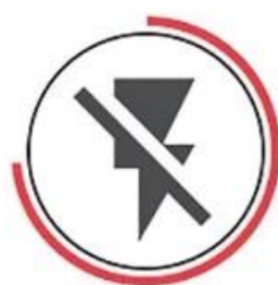
Not Conduct Electricity