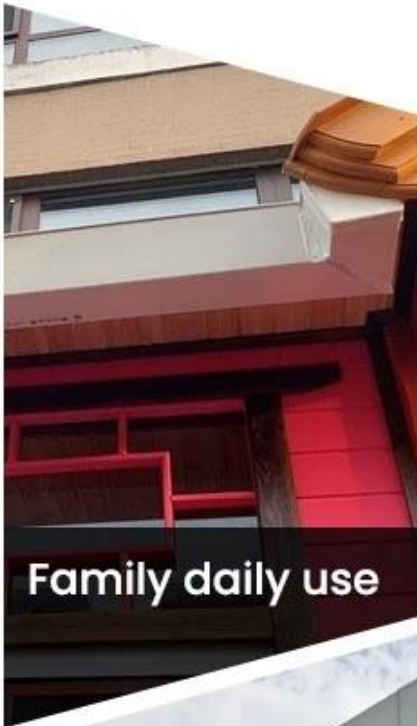
Family daily use