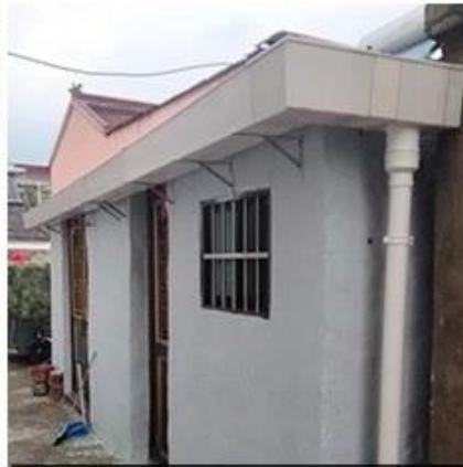
The villa receives water