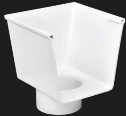
Drain end cap