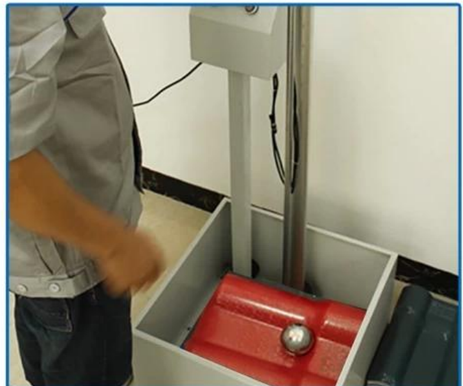
Impact resistance testing