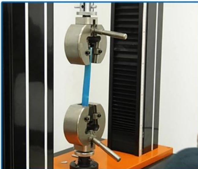
Tensile force testing