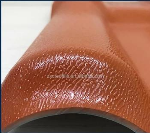
Surface asa material Lasting Color