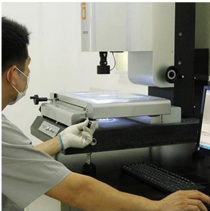
ASA Surface Thickness Test