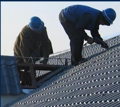
Easy and Quick Installation