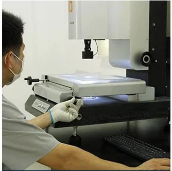
ASA SURFACE THICKNESS TEST