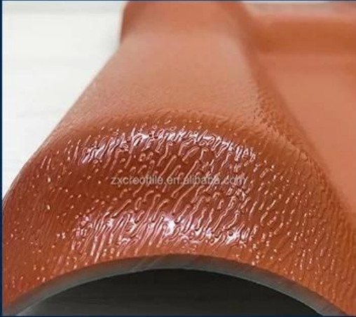
Surface asa material Lasting Color