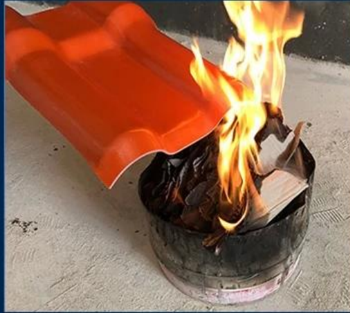
Fire Proof Grade B1