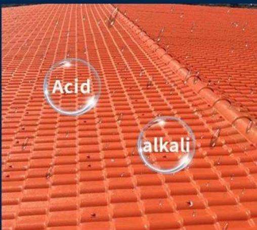
Anti-corrosion, Acid and Alkali Resistance