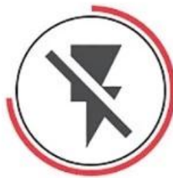
Not Conduct Electricity