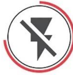
Not Conduct Electricity