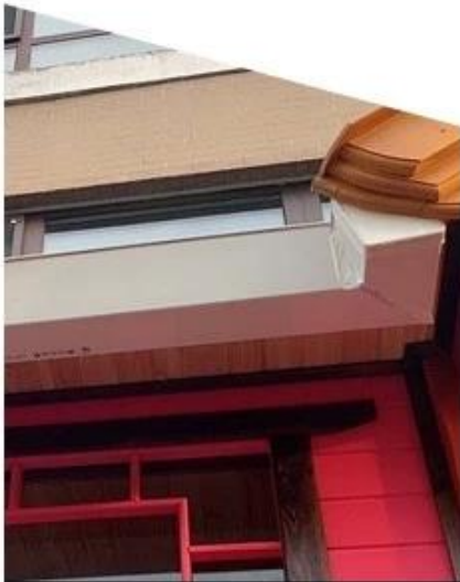
Family daily use