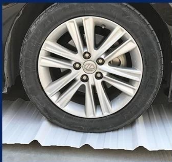
Strong pressure resistance