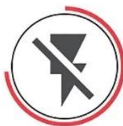
Not Conduct Electricity