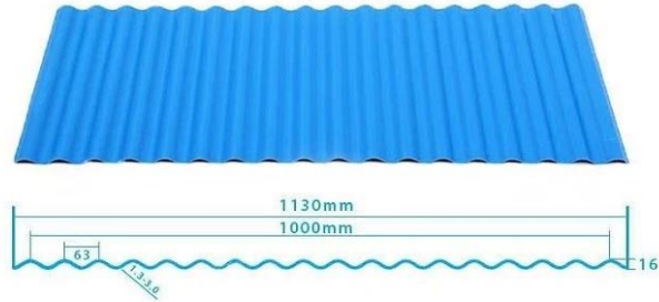
1130 trapezoidal sheets